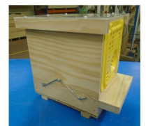
Piège à grilles Néoppi jaunes