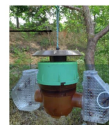
Piège coréen à ailes